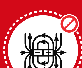
Otros artículos peligrosos

Tales como ácidos, pilas mojadas, baterías, mercurio y aparatos que contengan mercurio.