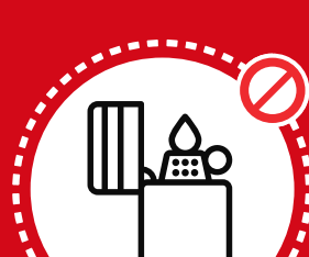
Fósforos y artículos de fácil ignición

Encendedores desechables, recargables y fósforos.