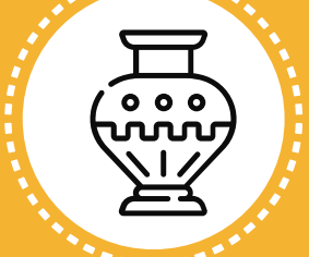
Bienes de patrimonio cultural